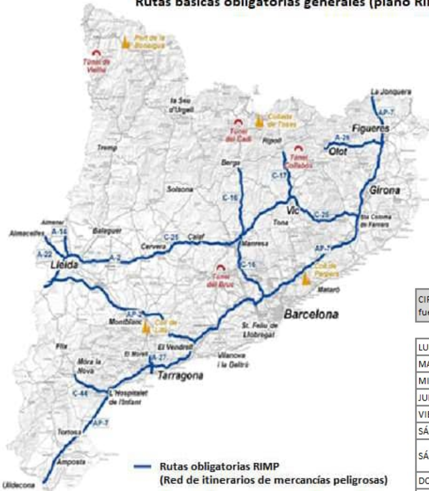
CIRCULACIÓN PERMITIDA EN EL TÚNEL DE VIELHA fuera de horarios sin equipos de emergencia en el túnel